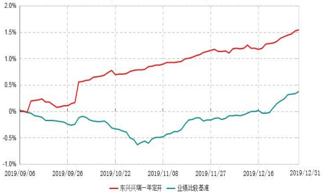
东兴兴瑞一年定期开放债券型证券投资基金累计净值增长率与业绩比较基准收益率历史走势对比图 (2019年09月06日-2019年12月31日)

注：本基金基金合同生效日为2019年9月6日，根据相关法律法规和基金合同，本基金建仓期为基金合同生效之日起6个月内。截至报告期末，本基金合同生效不满六个月，仍处于建仓期。