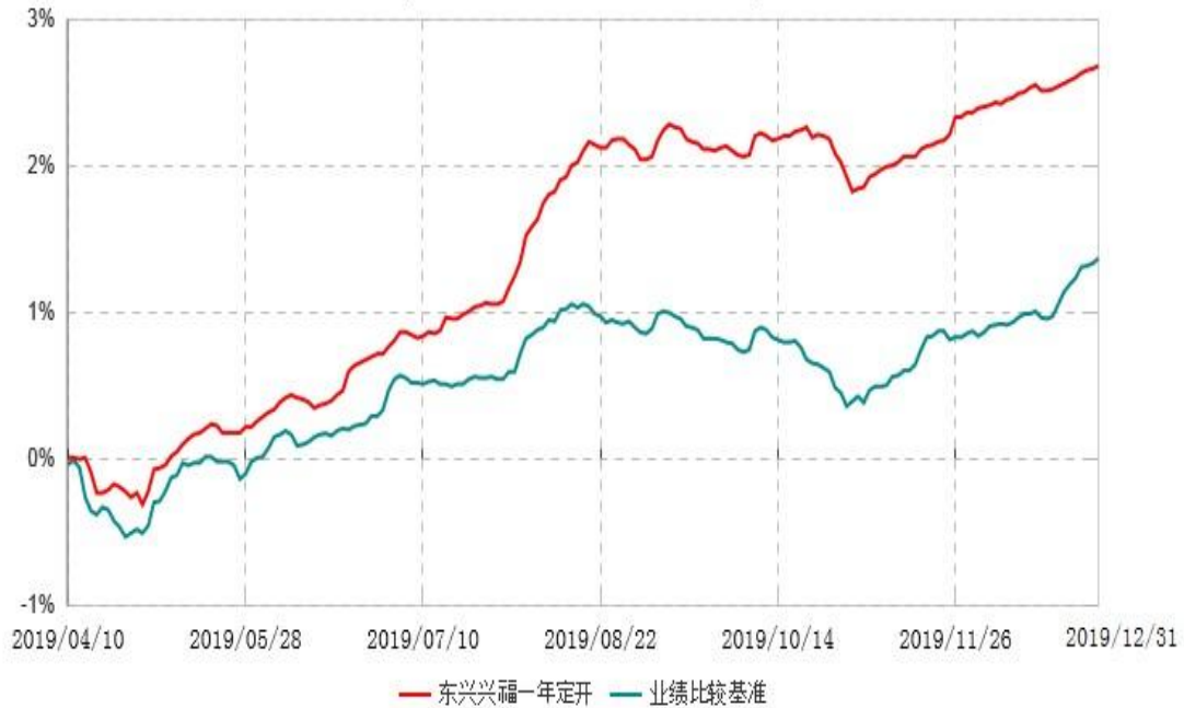
东兴兴福一年定期开放债券型证券投资基金累计净值增长率与业绩比较基准收益率历史走势对比图 (2019年04月10日-2019年12月31日)

注：1、本基金基金合同生效日为2019年4月10日，根据相关法律法规和基金合同，本基金建仓期为基金合同生效之日起6个月内，截至本报告期末已完成建仓但距建仓结束不满一年；