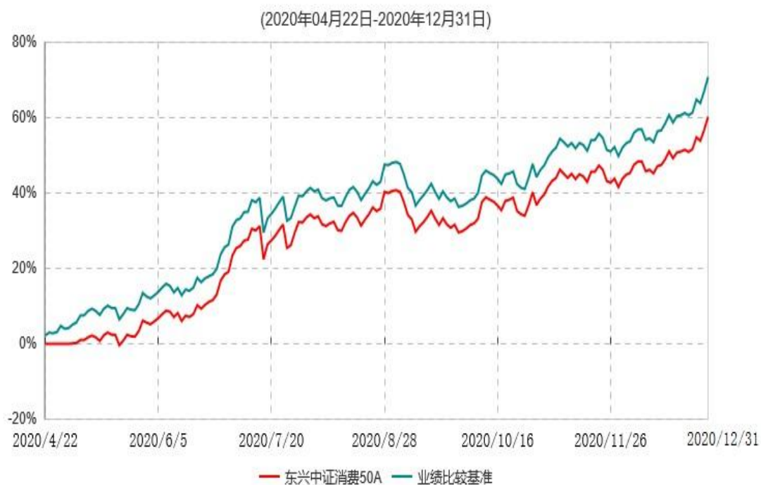
东兴中证消费50A累计净值增长率与业绩比较基准收益率历史走势对比图