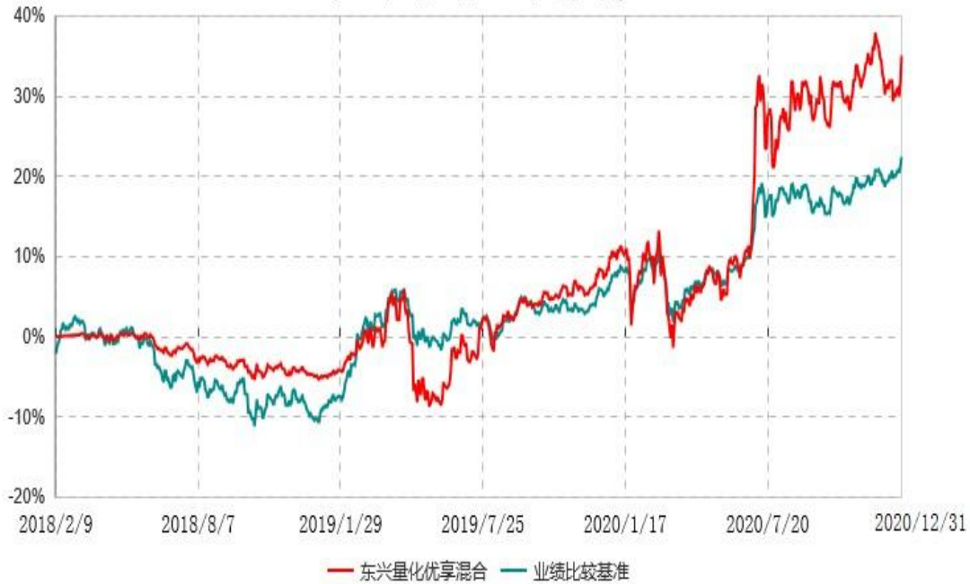
东兴量化优享灵活配置混合型证券投资基金累计净值增长率与业绩比较基准收益率历史走势对比图 (2018年02月09日-2020年12月31日)